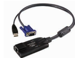
USB虚拟媒体 电脑端模块 KA7570 x 147