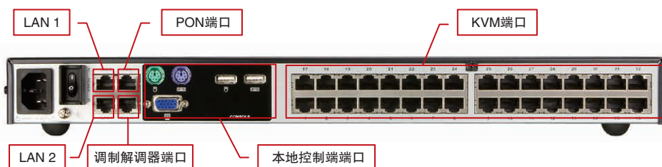
• KN4132 后视图