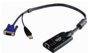
USB虚拟媒体 电脑端模块 KA7170 x 10